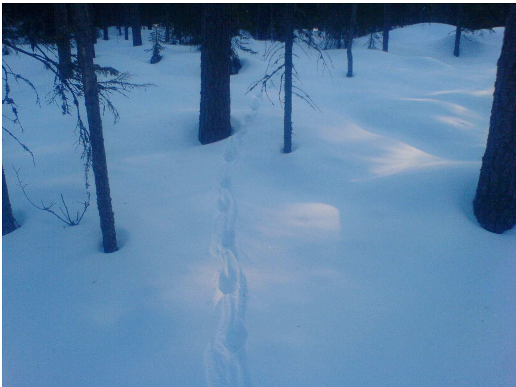
Bild 3. Färskt spår av lodjur vid Rågmosamyran 28/3.