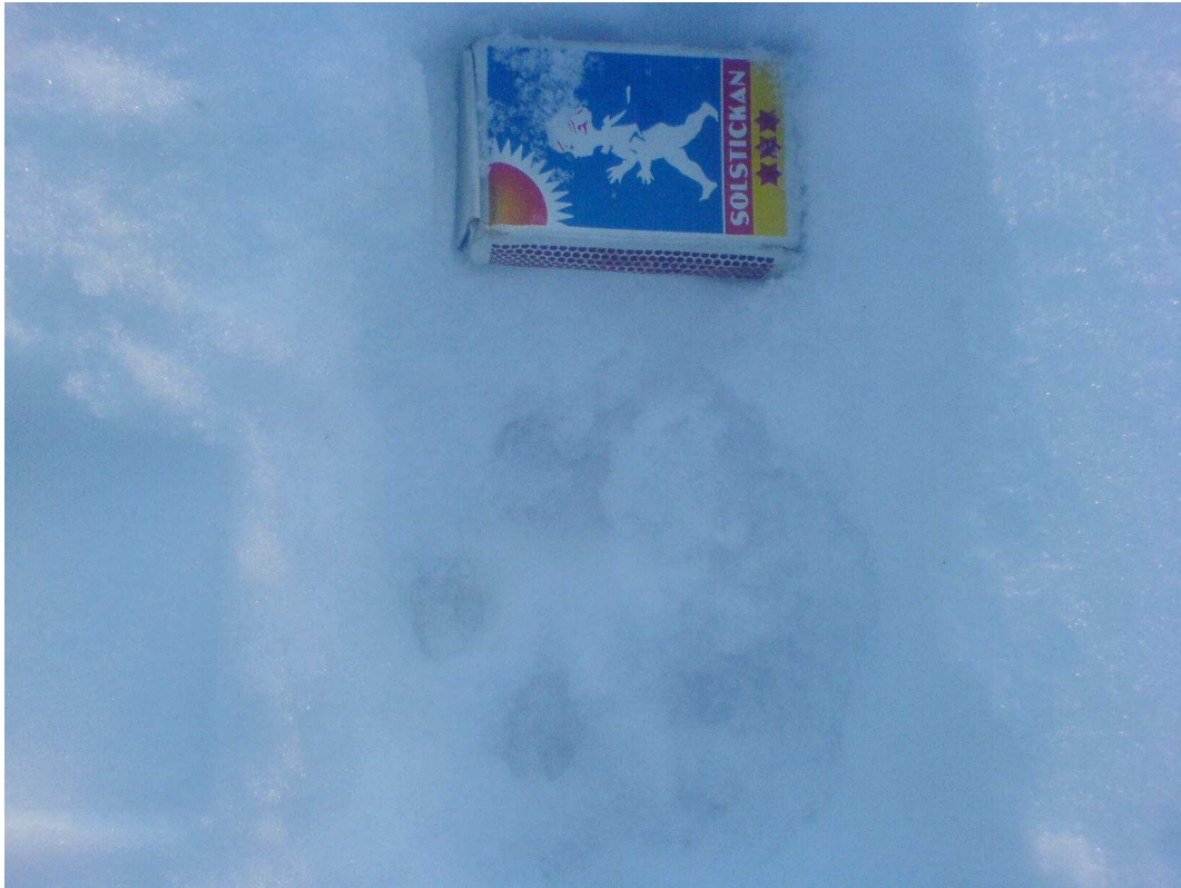
Bild 4. Färsk spårstämpel av lodjur vid Rågmosamyran 28/3.