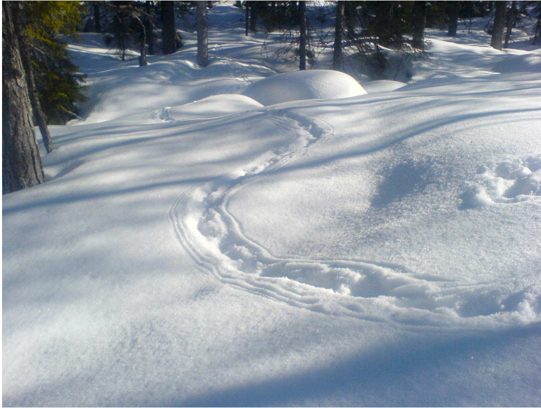
Bild 2. Spår av spelande tjäder vid Isberget 24/3.