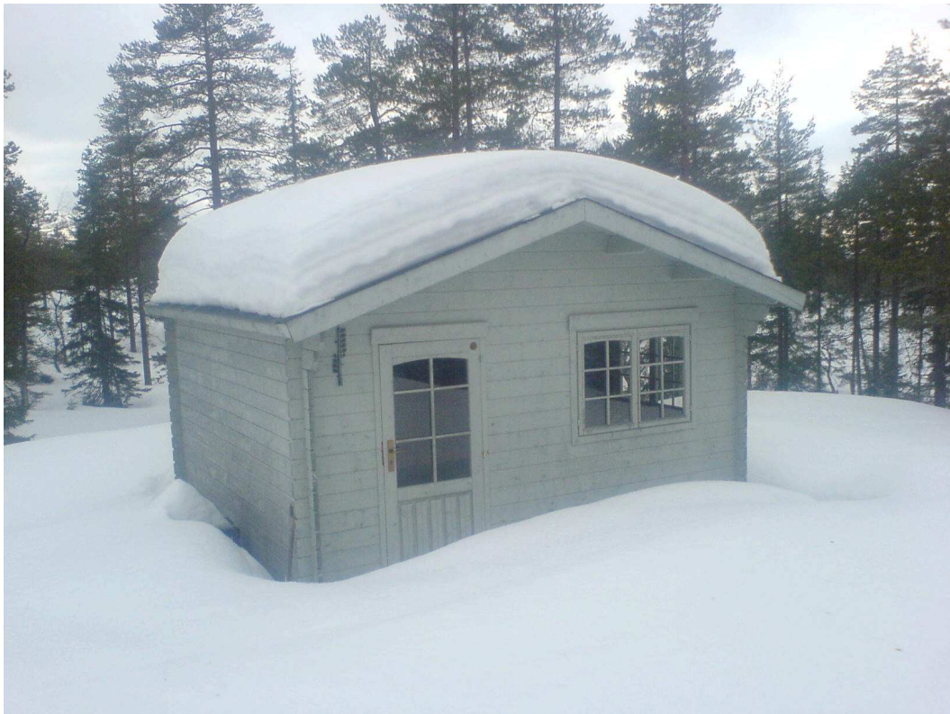
Bild 7. Jaktstuga nära verk 17.