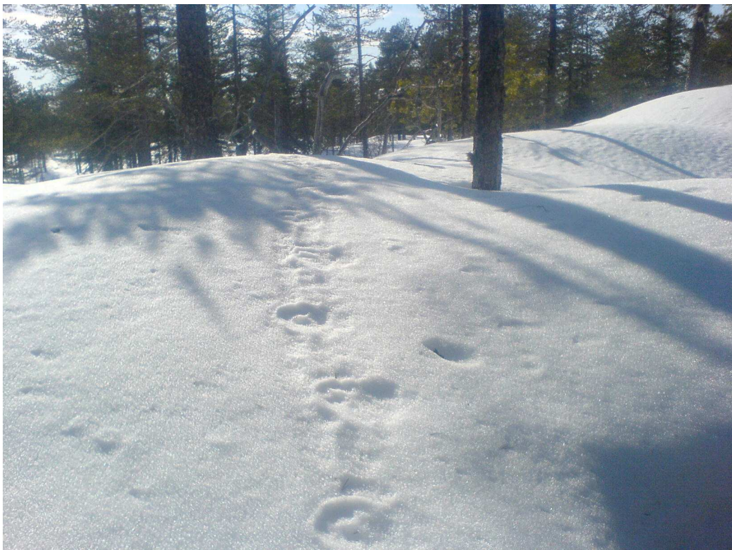
Bild 5. Någon dag gammalt lospår vid Iltjärnsmyran 30/3.