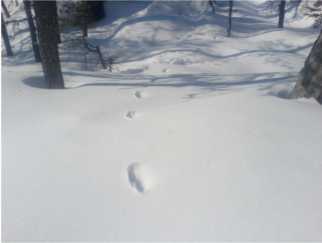
Bild 6. Dagsfärskt spår av mård den 28/3.