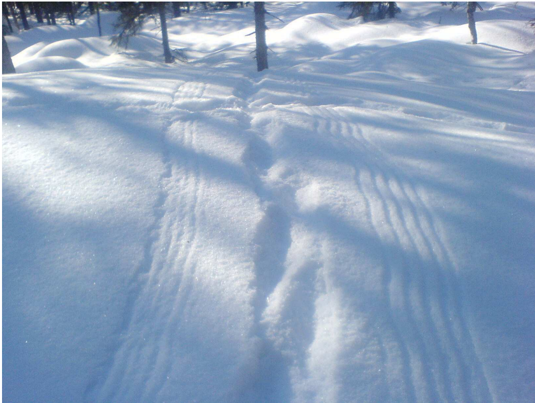
Bild 1. Spår av spelande tjäder vid Isberget 24/3.