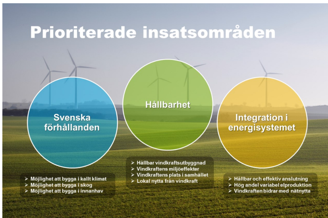
Figur 1. Prioriterade områden i Energimyndighetens vindkraftsstrategi 2016-2017

Tre huvudområden med tillhörande underområden har prioriterats i strategin. Dessa är svenska förhållanden, hållbarhet samt integration i energisystemet.