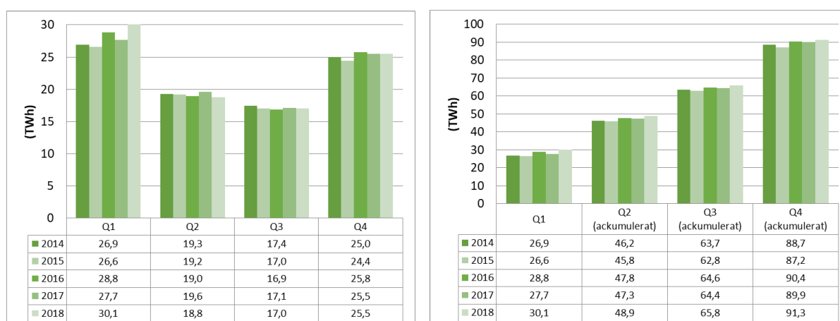
Figur 2. Information om kvotpliktig elanvändning i Sverige är beräknat med ett beräkningsverktyg och ska därför inte betraktas som faktisk kvotpliktig elanvändning. Figurerna visar kvotpliktig elanvändning per kvartal samt ackumulerat över året.

Mer information om beräkningsverktyg finns här.